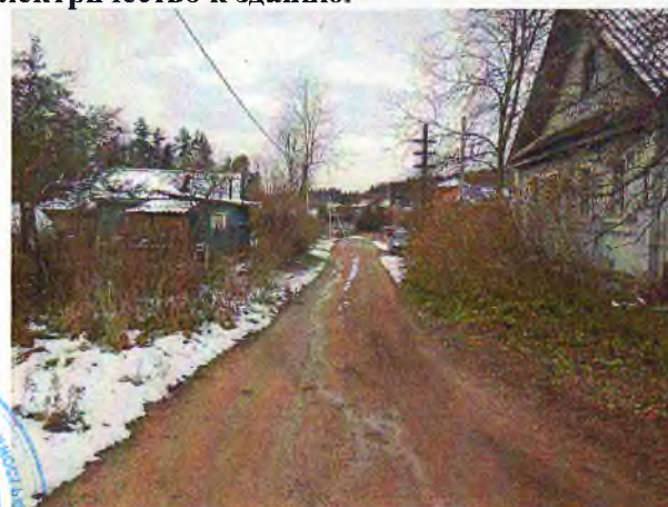
Фото 21, 22. Ближайшее окружение. Подъездные пути.