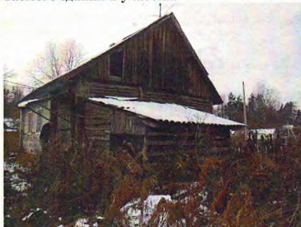
Фото 3, 4. Общий вид оцениваемого здания