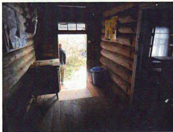
Фото 15, 16. Состояние внутренних помещений.