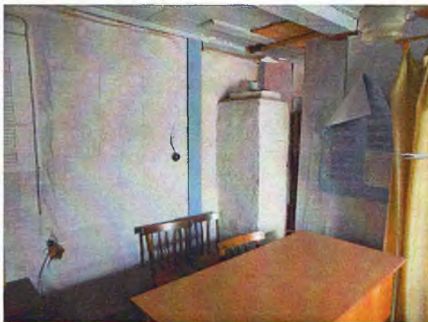
Фото 7-10. Состояние внутренних помещений.