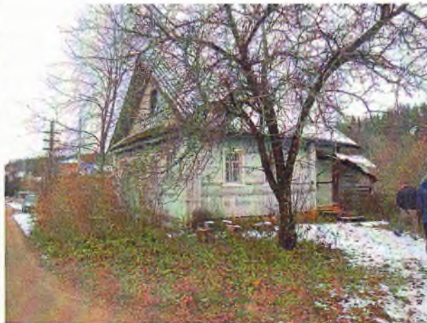
Фото 1, 2. Общий вид оцениваемого здания и участка.