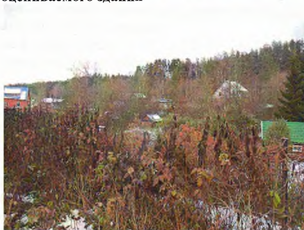
Фото 6. Участок за домом. Ближайшее окружение