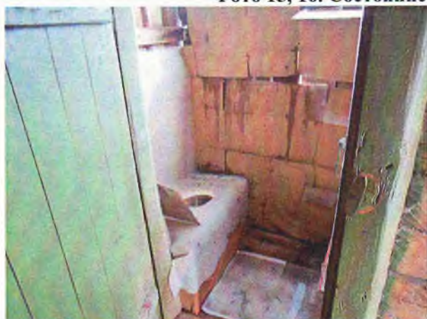
Фото 17. Туалет