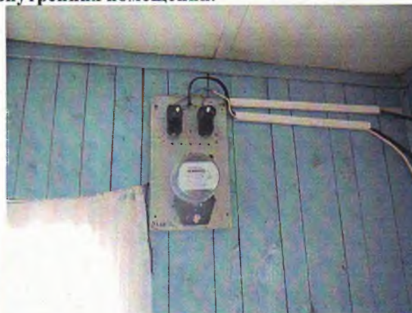
Фото 18. Счетчик.