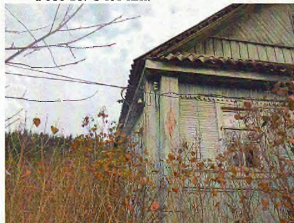
Фото 19,20. Подведено электричество к зданию.